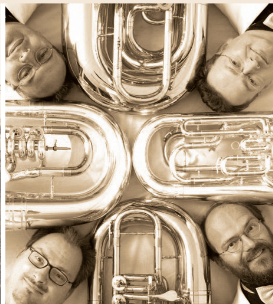
Das „Melton Tuba Quartett“ In ihrem Fach Weltklasse